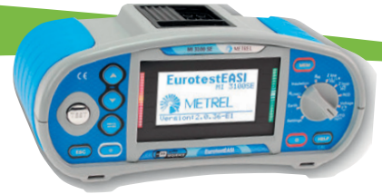
Tabla resumen de funciones